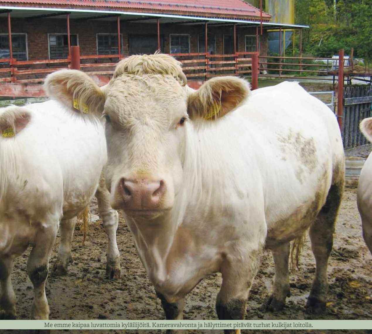
Me emme kaipaa luvattomia kyläilijöitä. Kameravalvonta ja hälyttimet pitävät turhat kulkijat loitolla.